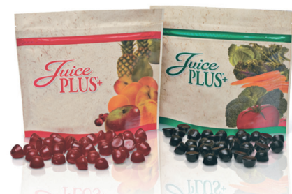
Juice PLUS+ voće i povrće u kapsulama i gumenim bombonama!